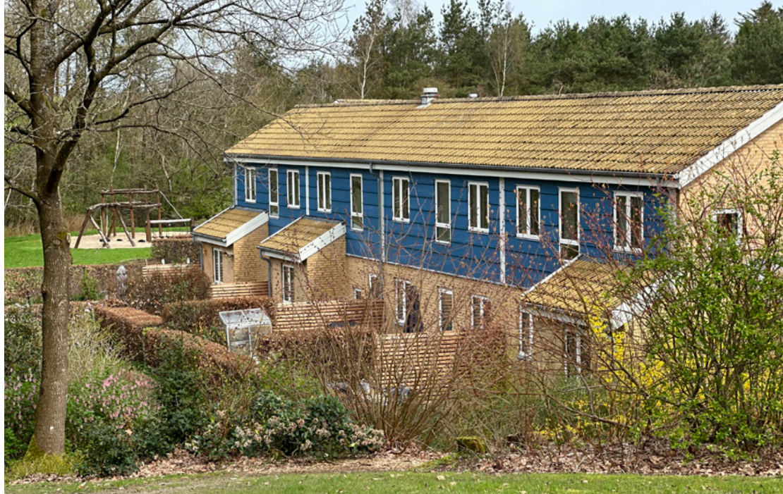
Afd. 20 - Blåbærhusene, Arendalsvej 302-422.

få økonomien til at hænge sammen, så renoveringen ikke medfører huslejestigning for beboerne.