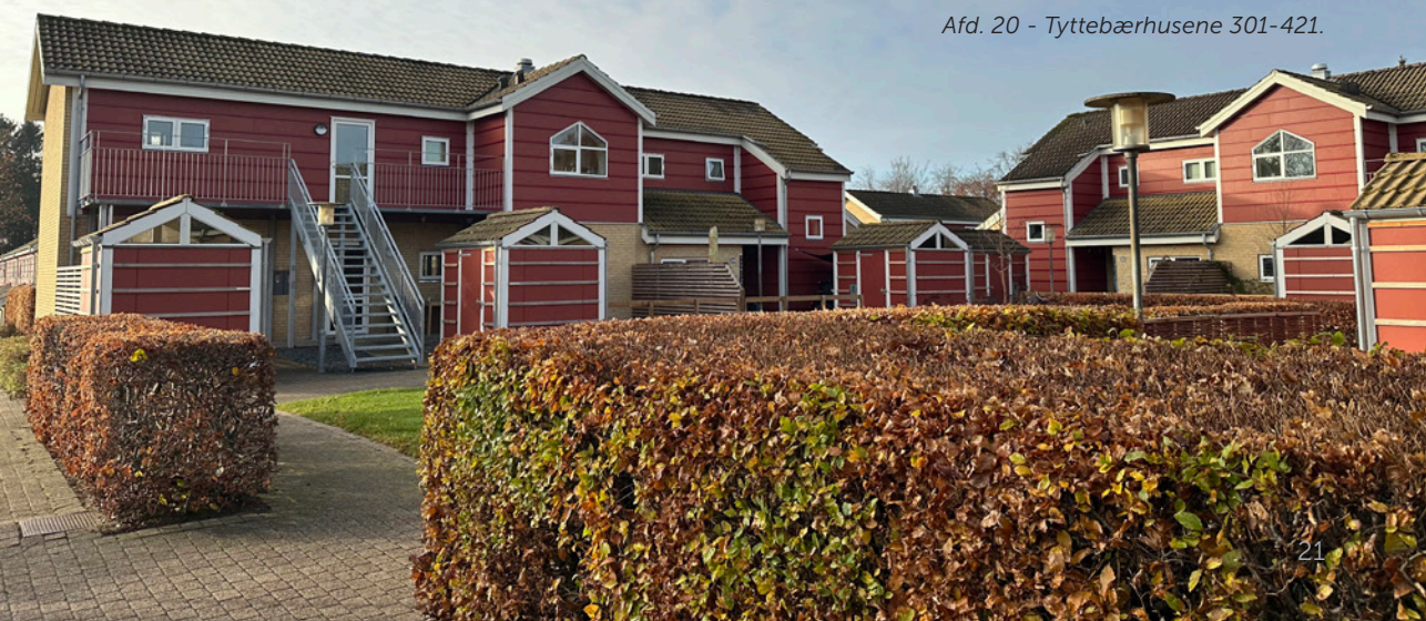
Afd. 20 - Tyttebærhusene 301-421.

Arbejdernes Byggeforening ser frem til den glæde renoveringen forhåbentlig vil bringe beboerne i afdelingen.