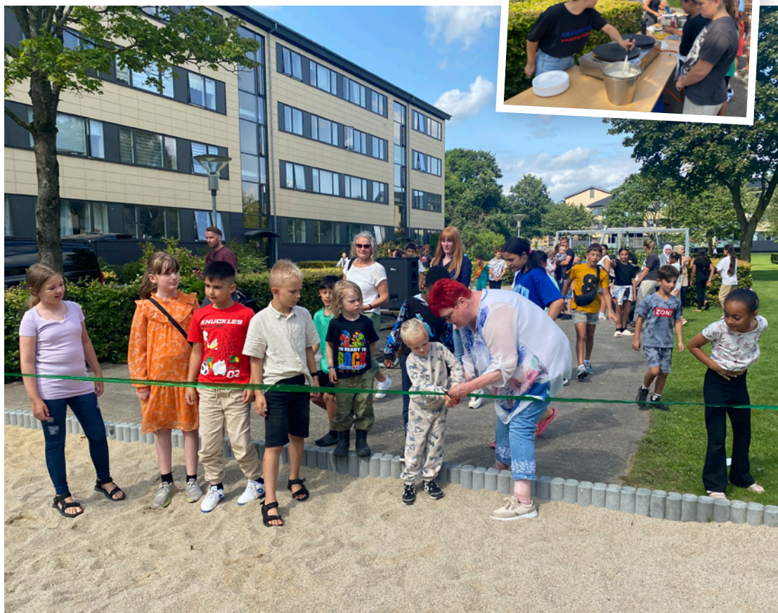
Snoren blev behørig klippet.