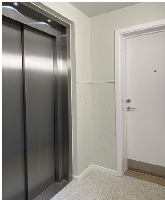
Elevator i flere opgange.

I nyindretningen er der fokus på at åbne lejlighederne, så lukkede værelser erstattes af gennemlyste, åbne rum med masser af dagslys og luft. En del af boligerne indrettes som tilgængelighedsboliger, hvilket betyder, at der er let adgang til boligen via elevator. Boligerne, er indrettet således, at en kørestolsbruger kan komme rundt i alle rum i boligen.