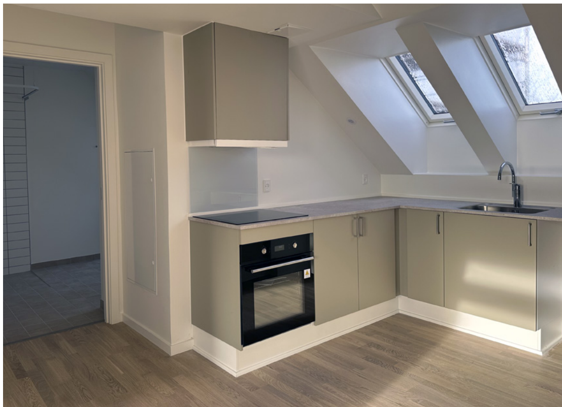
Nye køkkener i alle boligerne.

På tagetagen på 3. sal opføres der 32 nye taglejligheder, hvor flere af dem får en flot udsigt over søerne og Silkeborg centrum.